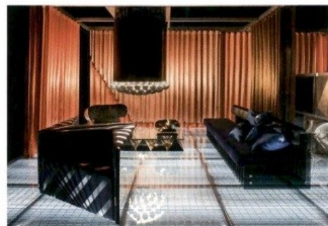
L'incroyable présentation de DimoreMilano dans un ancien cinéma.